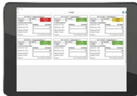
L-mobile SCADA képernyő