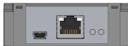
MSE előlapi elrendezés