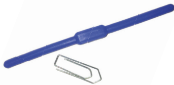
RFID-Tag (UHF) wird ab Werk mit eingenäht

Direkt beim Hersteller wird die Brandschutzbekleidung mit einem RFID-Tag versehen und automatisch in L-mobile trace angelegt. Alle relevanten Informationen werden somit gleich von Beginn an gespeichert. Sie bekommen direkt beim Kauf Zugriff auf das Webportal und können dort Ihre Prüfzyklen festlegen, einsehen und dokumentieren. Über die so erstellten Daten können Berichte generiert werden, die eine Inventarisierung ermöglichen.